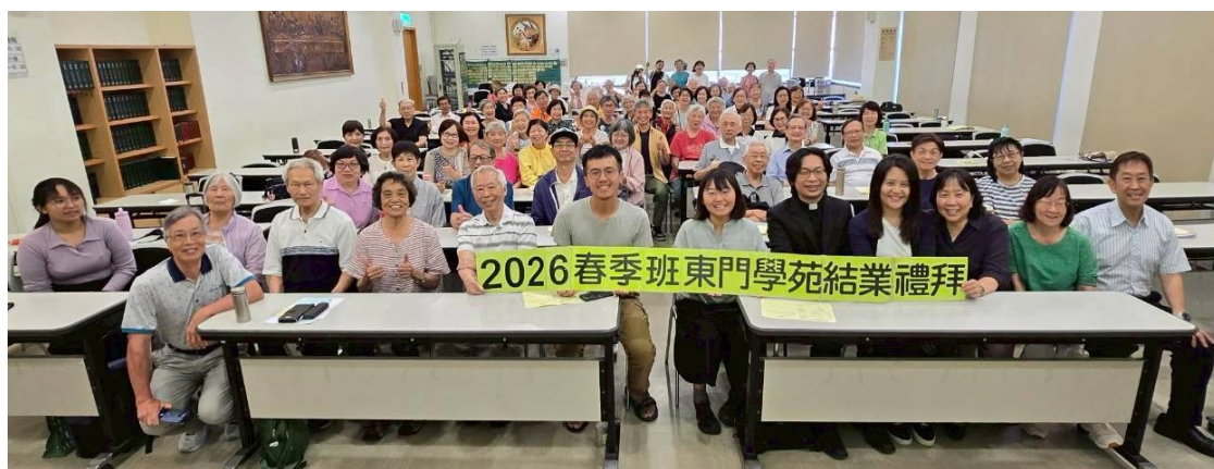
20260618 東門學苑秋季班結業感恩禮拜