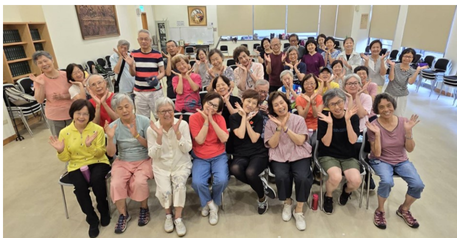
20260625 東門樂齡體適能課程春季班結業大合照