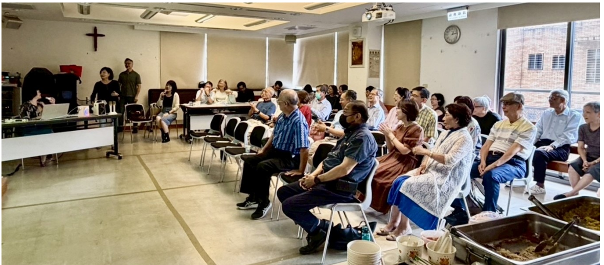
20260614 喜樂+荊棘團契：福音歌曲卡拉 OK