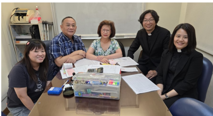
20250831 全教會小組日：財務組