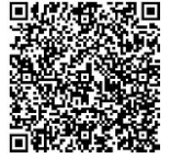
索票 QR code