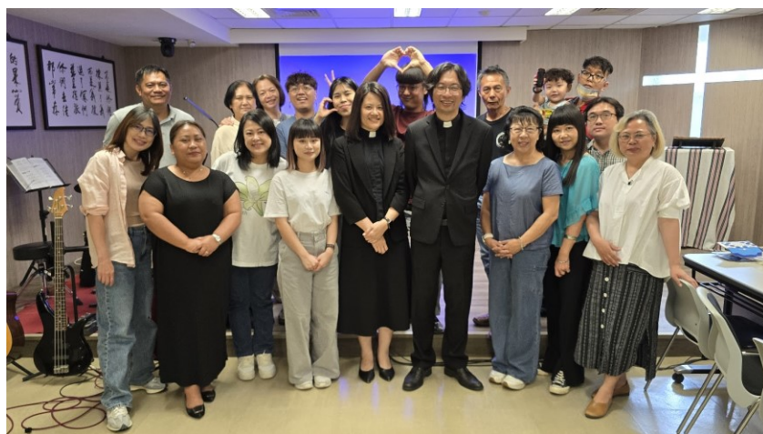
20250831 全教會小組日：原住民團契