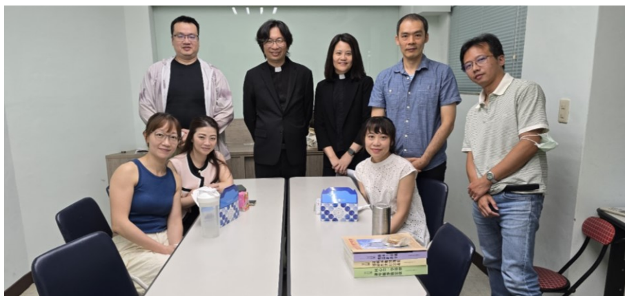
20250831 全教會小組日：第 23 小組