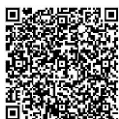
師資報名 QR code

不要求六天營會全程參與，若您僅能參加一天活動，都是滿心感謝。歡迎大家加入「愛在這塊土地上」師資同工行列，一同陪伴下一代在聖經教導中、在主裡成長！同工招募詳情請見下方 QR-Code 連結，謝謝！