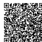
索票 QR code