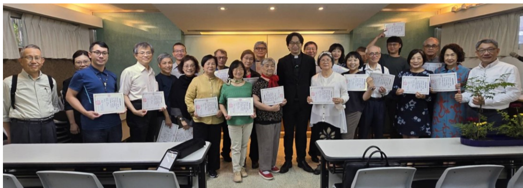
20260426 頒發《士師記》查經課程證書