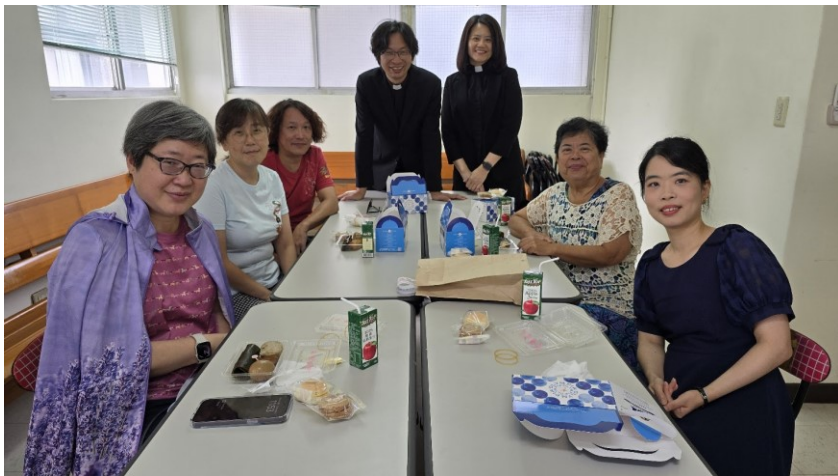
20250831 全教會小組日：第 18 小組