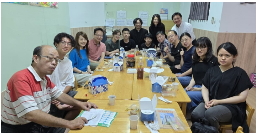
20250831 全教會小組日：第 19+20+21 小組