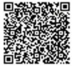
第二季季表 QR code