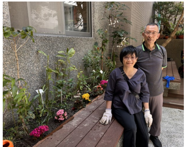
園藝小組迎接 80 週年栽種花卉