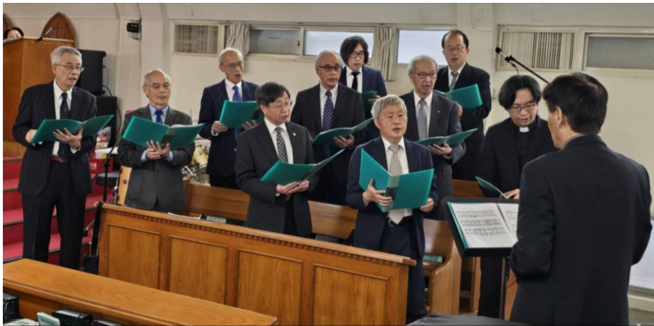
20260329 男聲詩班獻詩服事