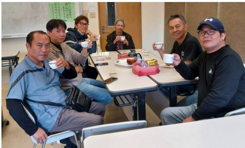
20260118 原住民堂弟兄團契分享會