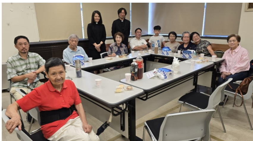
20250831 全教會小組日 第 7 小組