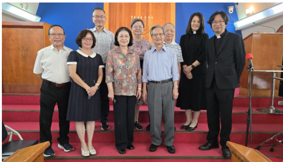
20250831 全教會小組日 第 9 小組