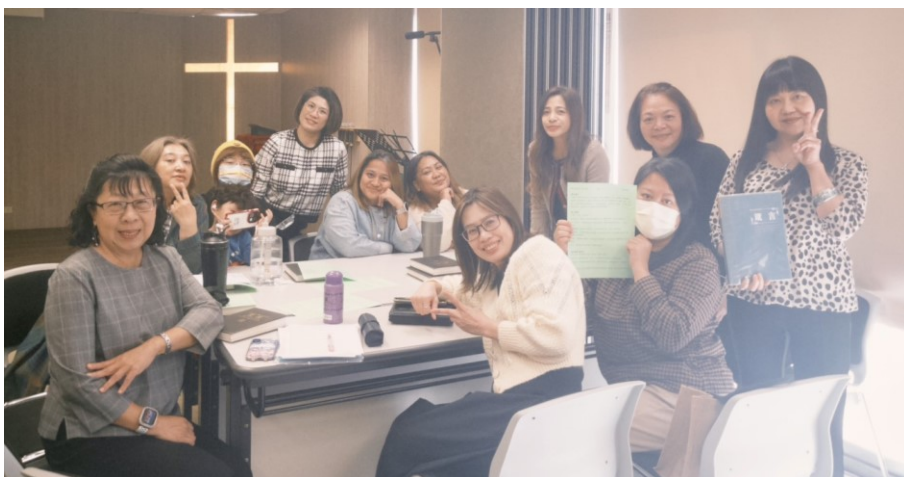
20260118 馬大與馬利亞團契分享會