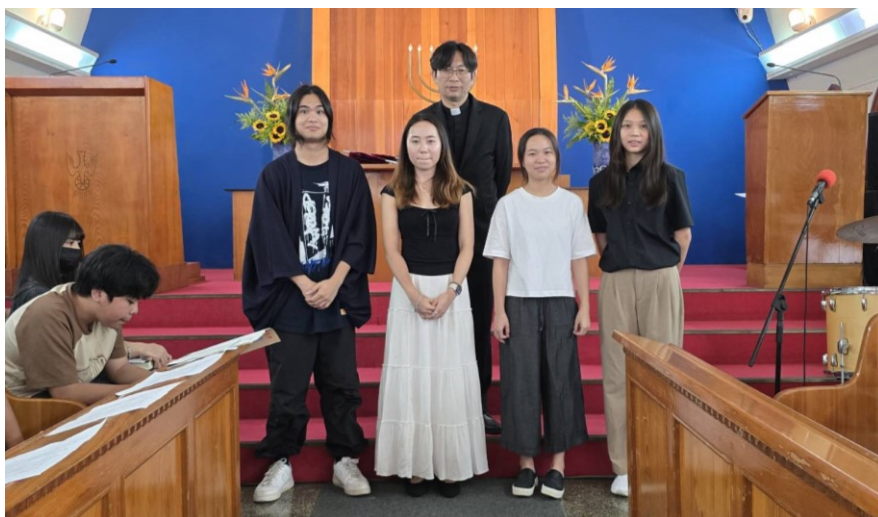
20250914 升級祝福禮拜 大學組