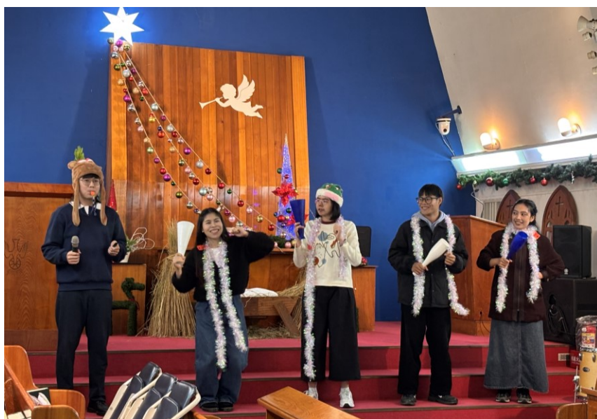
20251221 聖誕午會：JS 團契