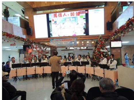
2016/12/05 聖誕節期於馬偕醫院音樂分享會