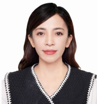
恩樂 · 拉儒亂