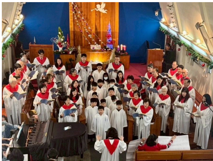
20251221 聖誕讚美禮拜——聖歌隊獻詩