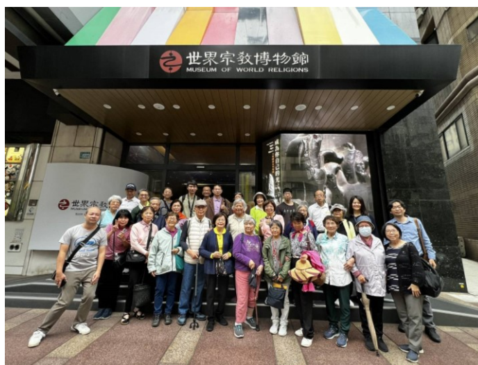
20251130 全教會教育講座 走讀-1：世界宗教博物館