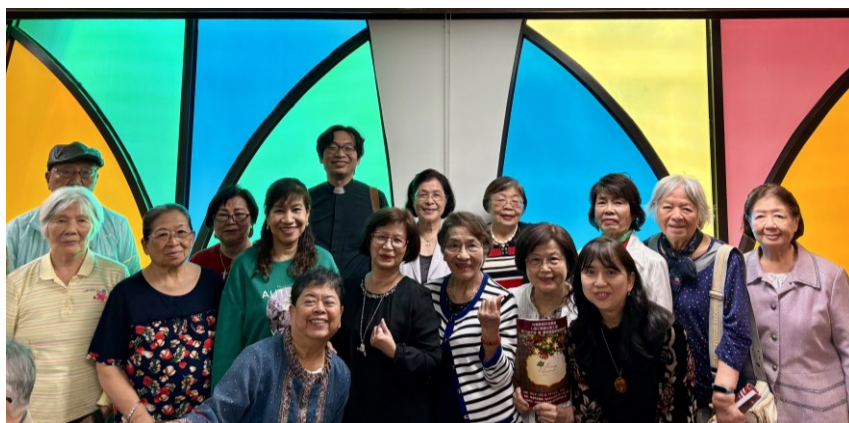
20251201 婦女事工部年會&聖誕慶祝會