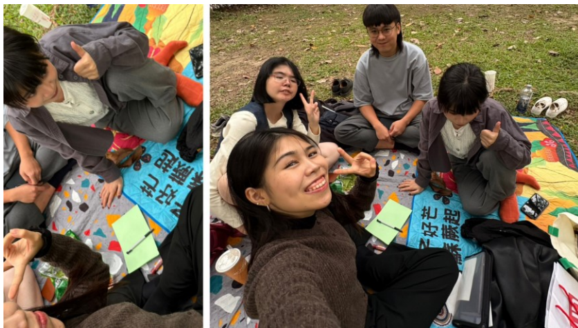
20251130 JS 團契聚會：安森見！大安森林公園野餐