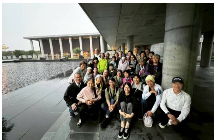
20251130 全教會教育講座 走讀-2：農禪寺