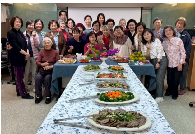
20251203 姊妹團契心靈園地年終聚餐