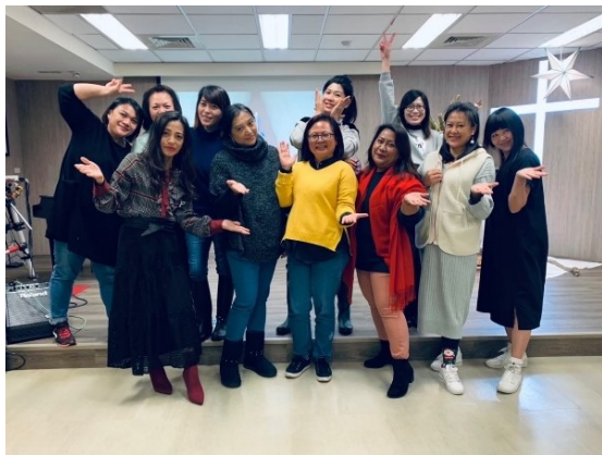
主日禮拜服事合影

團契宗旨為，透過耶穌基督，讓契友在信仰中成長、彼此扶持。團契生活核心在於與上主也與人建立和諧的關係，並使生活各層面寸步不離信仰。