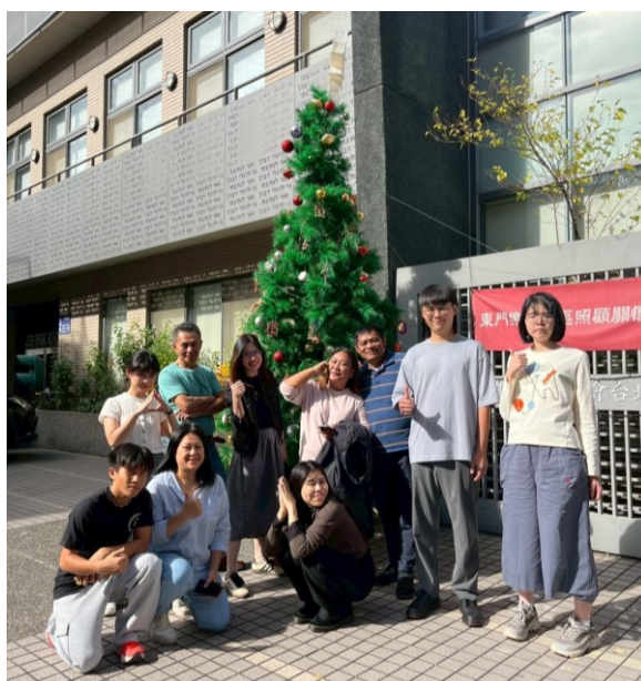
20251130 原住民堂聖誕布置