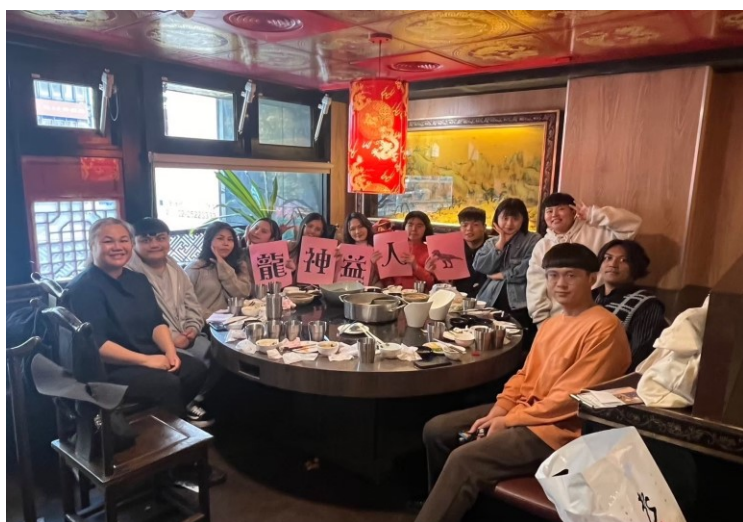
2024 年度聚餐暨幹部改選

除了定期聚會,JS 團契也參與在服事當中——原住民堂主日敬拜與獻詩、青年主日見證分享、節日活動(母親節、父親節、聖誕節)、大手拉小手(與原住民堂主日學一同戶外教學)、畢業典禮,透過事奉來回應上主恩典。