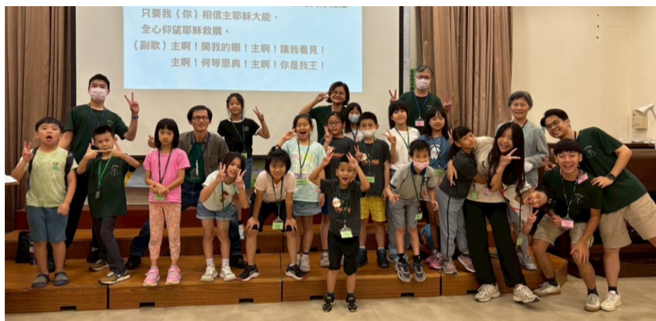
20250712 兒少營中年級師生合照