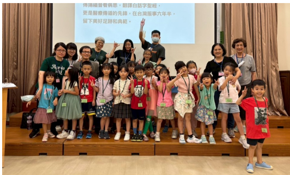
20250712 兒少營低年級師生合照