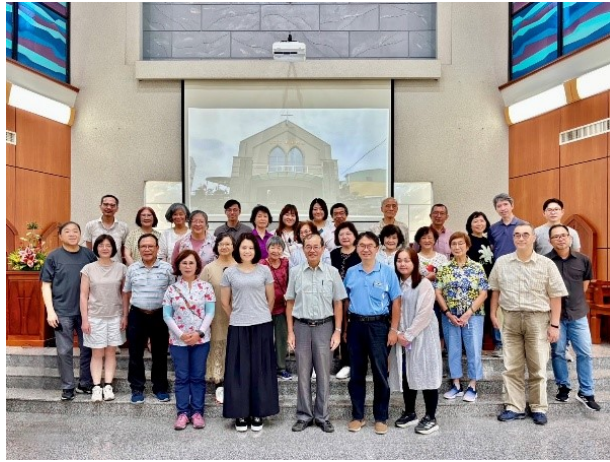
2025 李麻宣教腳蹤巡禮

上帝是聖歌隊的後盾，我們服事他，也與他同工，加上指揮、伴奏和每一位成員無私的擺上，讓聖歌隊的歌聲可以持續在禮拜中服事；然而未來聖歌隊仍面臨諸多挑戰，需要尋求上帝的帶領，及更多教會兄姊的關心與支持。首先是隨著整個社會法治化，合唱樂譜的版權使用有更嚴格的規範，雖然聖歌隊長年來堅持使用正版的合唱樂譜，但在實際運用上如何兼顧相關規範又能順利推展事工，實為值得留意的趨勢。其