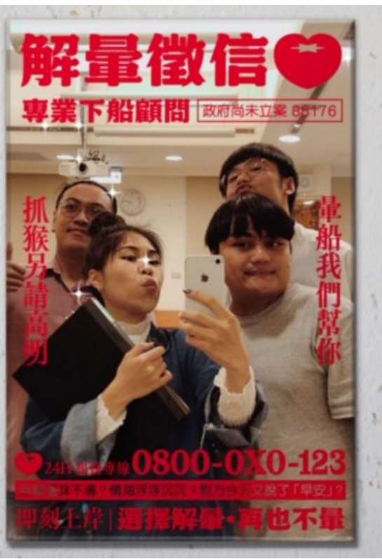
20240414 JS 團契聚會-眼鏡貓咪&解暈徵信