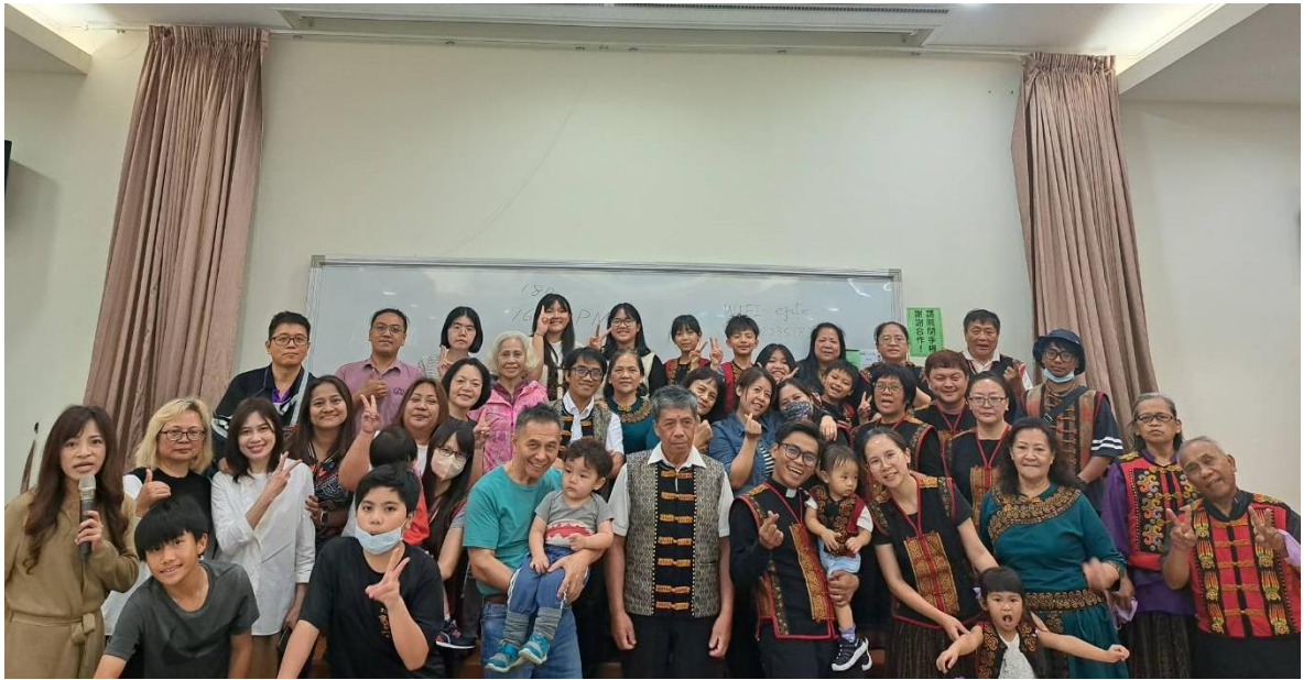
20240414 與排灣中會榮原教會交誼