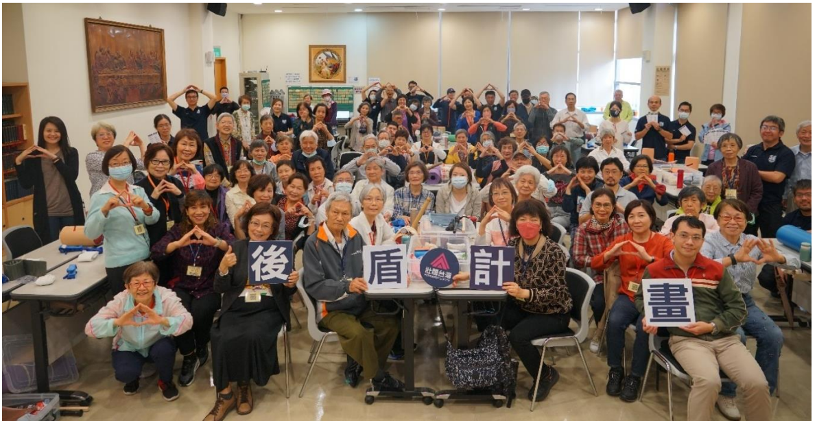
20240326 東門學苑-壯闊台灣《後盾計畫》災害應變課程