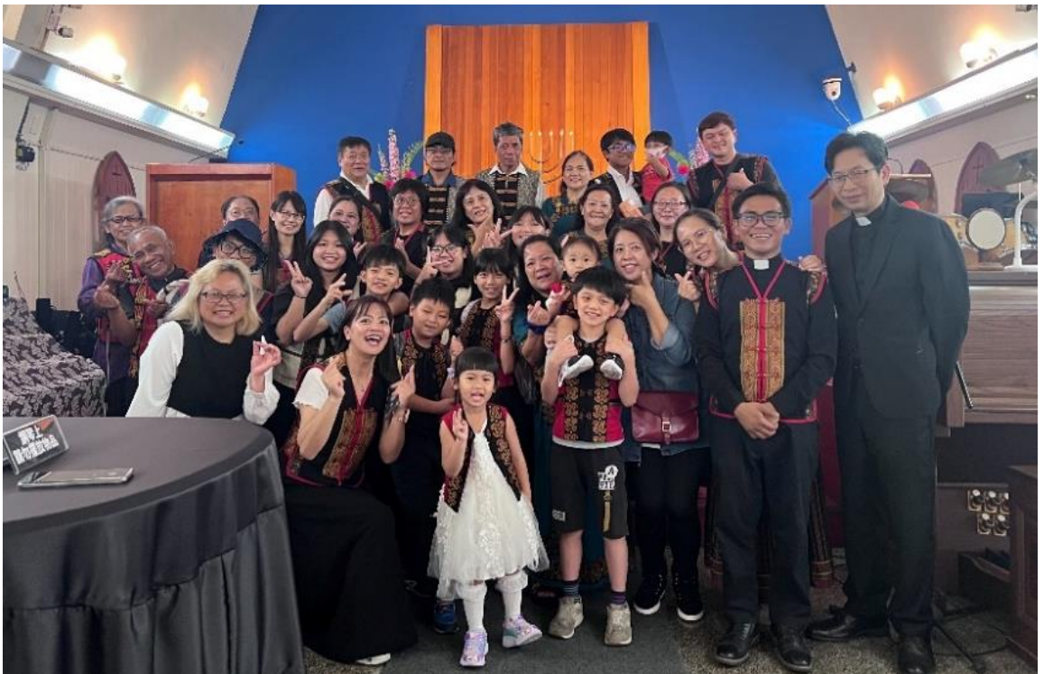
20240414 排灣中會榮原教會請安及獻詩