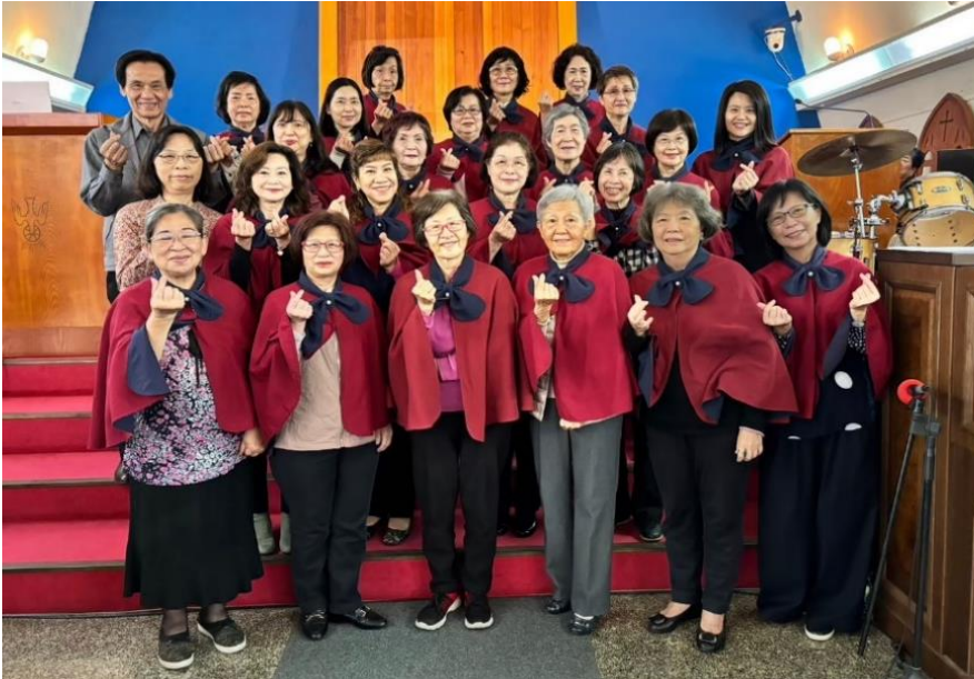
20240208 姊妹詩班新春獻詩

願神賜福姊妹詩班的溫暖歌聲，繼續陪伴著東門人！並傳承接力更多無數個 25 年～快加入東門姊妹詩班吧！