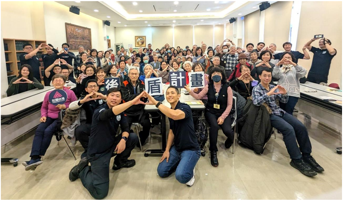
20240312 東門學苑-壯闊台灣《後盾計畫》-災害應變課程