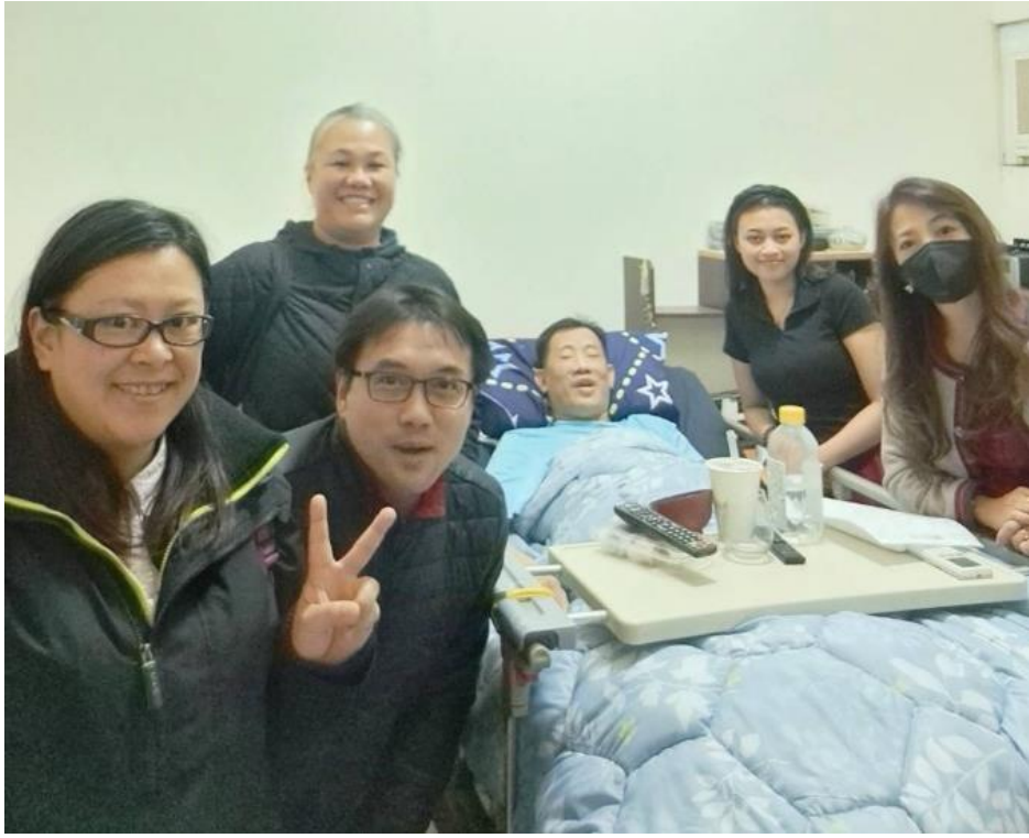
20240308 原民堂關懷組家庭探訪：高介堂弟兄