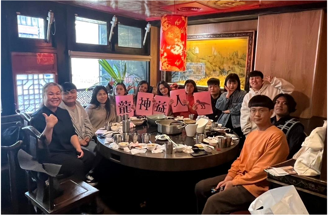
20240218 JS 團契新春聚餐暨幹部改選