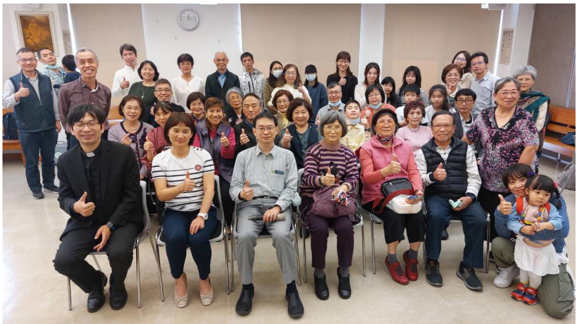
20240218 關懷組聯合荊棘團契-親子基礎急救課程及演練-2