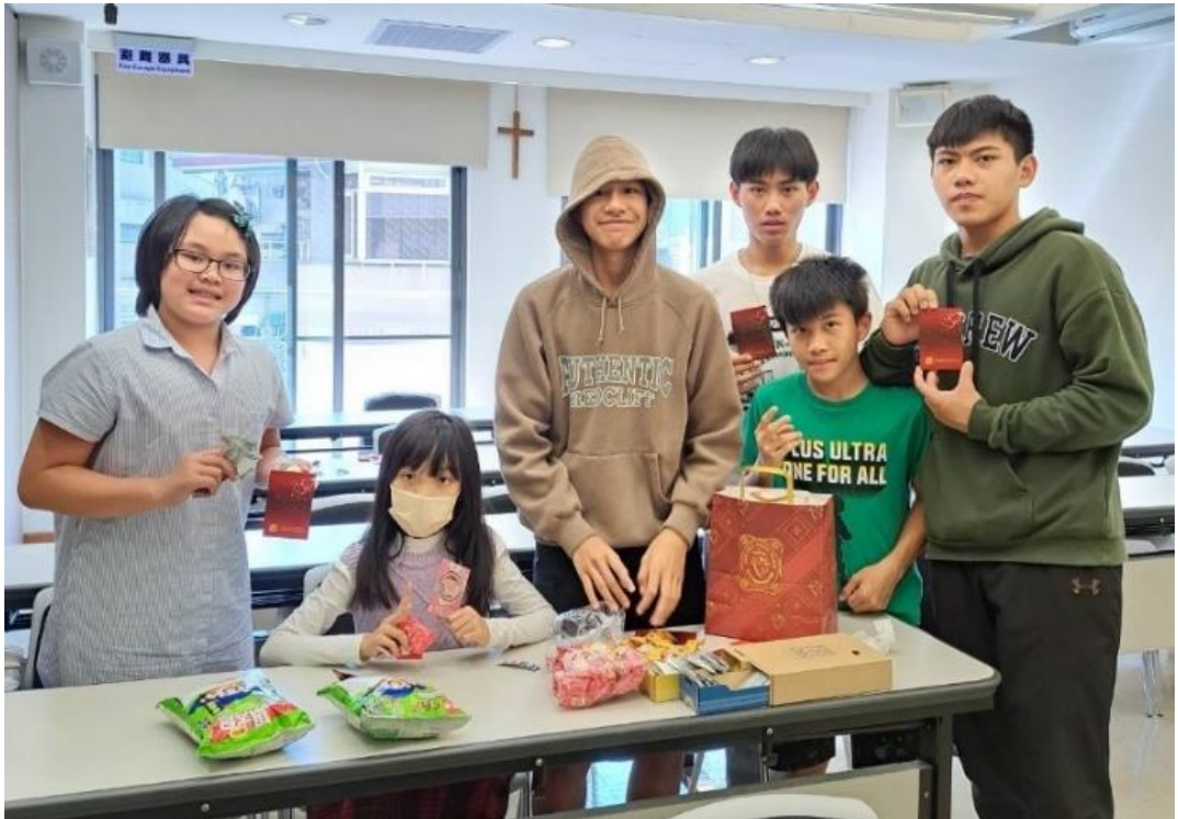
20240218 原民堂主日學團契新學期的祝福