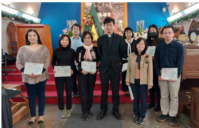
20240107 機構首長及團契會長就任式