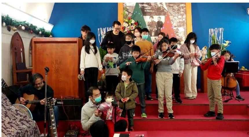
20231224 聖誕午會 荊棘團契-聖誕組曲