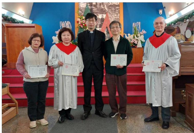
20240107 團契顧問頒發任命書