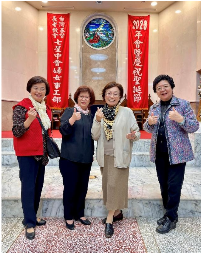
20231204 姊妹團契參加七星中會婦女事工部年會暨聖誕慶祝會