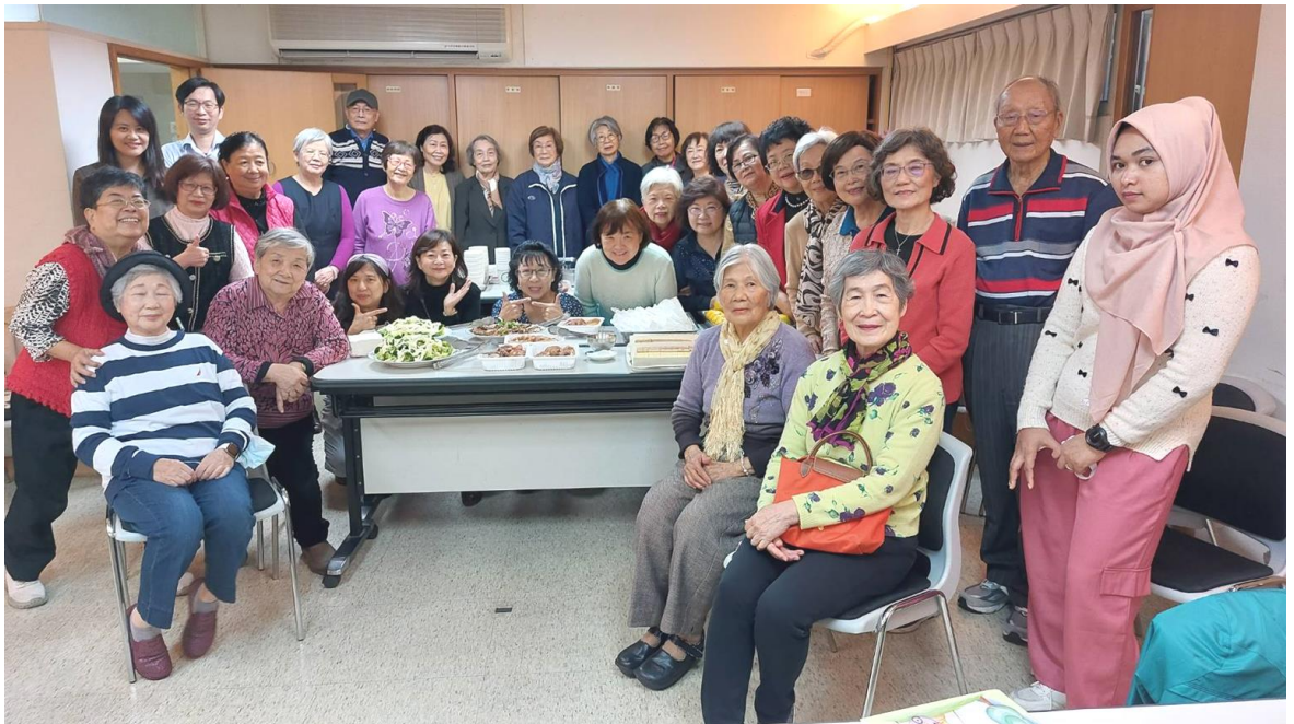
20231206 姊妹年終感恩餐會