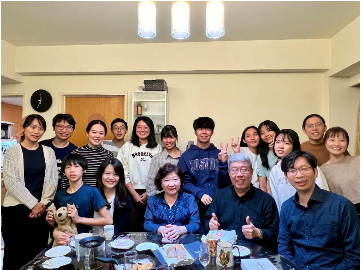
20231203 與大專青年聚會-牧師館