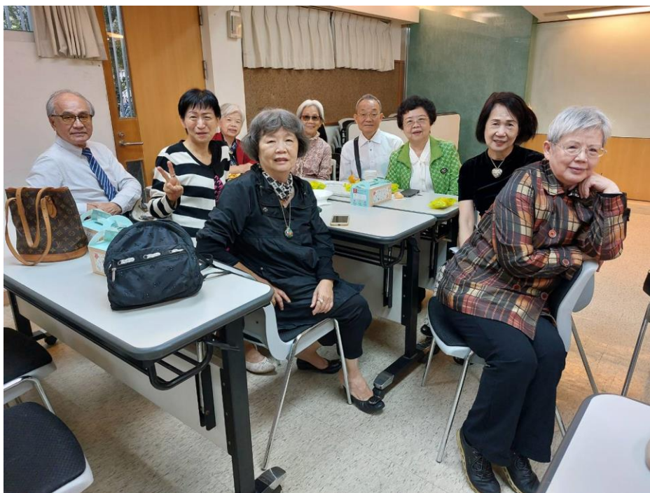
20231029 全教會聚會-第 10 組