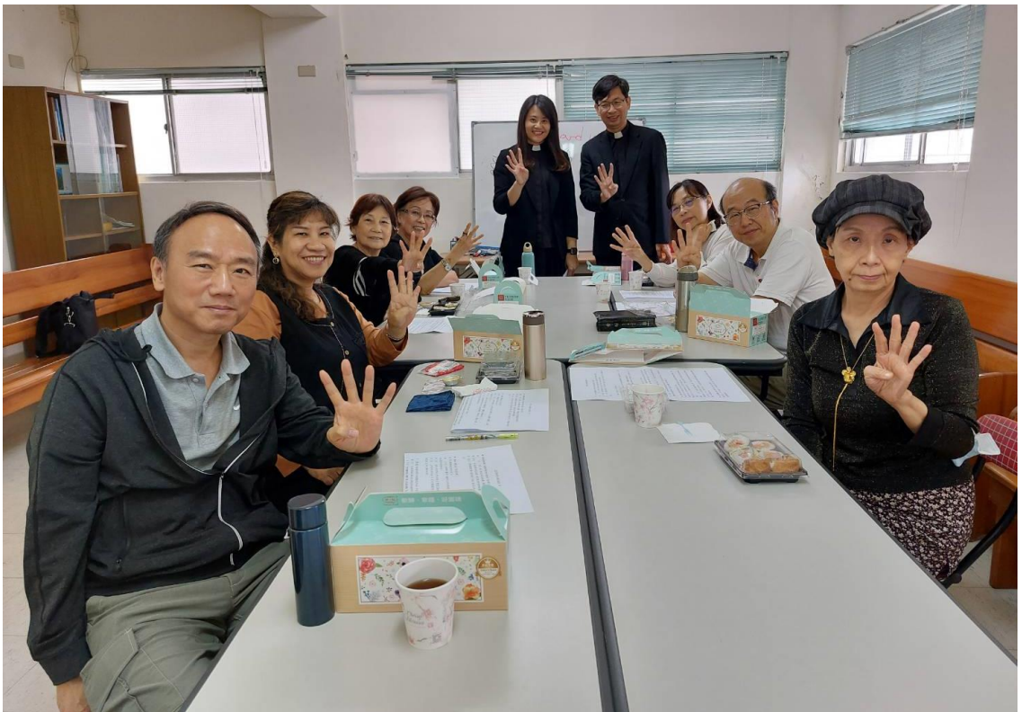
20231029 全教會聚會-第 4 組