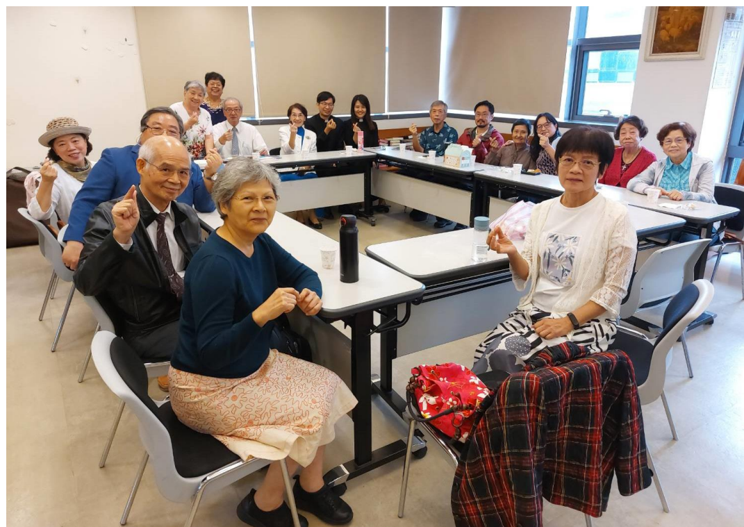
20231029 全教會聚會-第 7+15 組