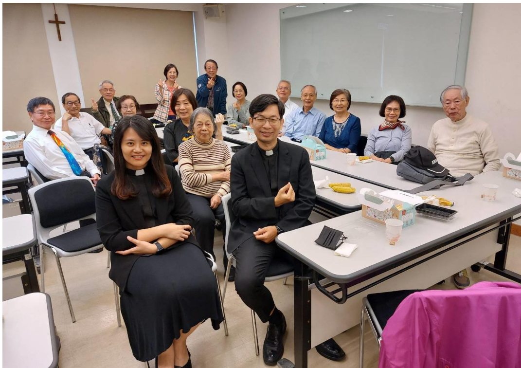
20231029 全教會聚會-第 6 組