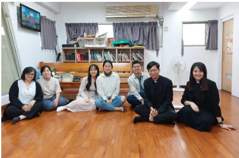
20231029 全教會小組聚會-學青+少契組