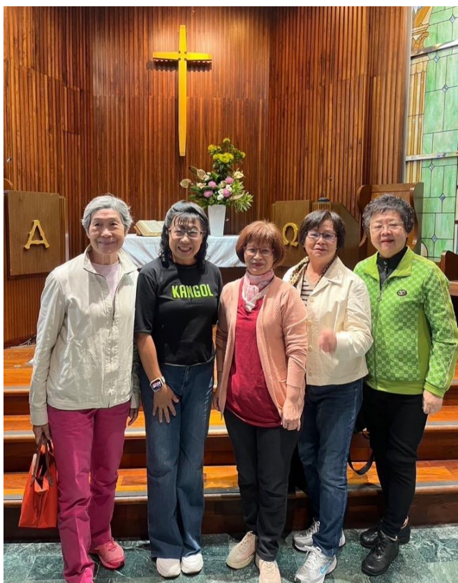
20231114 星中婦女事工部西小區年會暨聖誕慶祝同樂會-公館教會