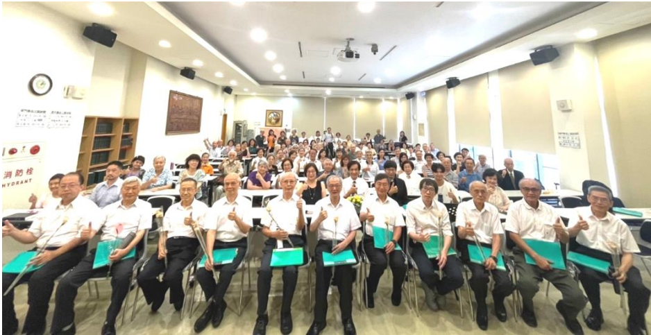
20230917 松契例會-男聲詩班十週年感恩分享會