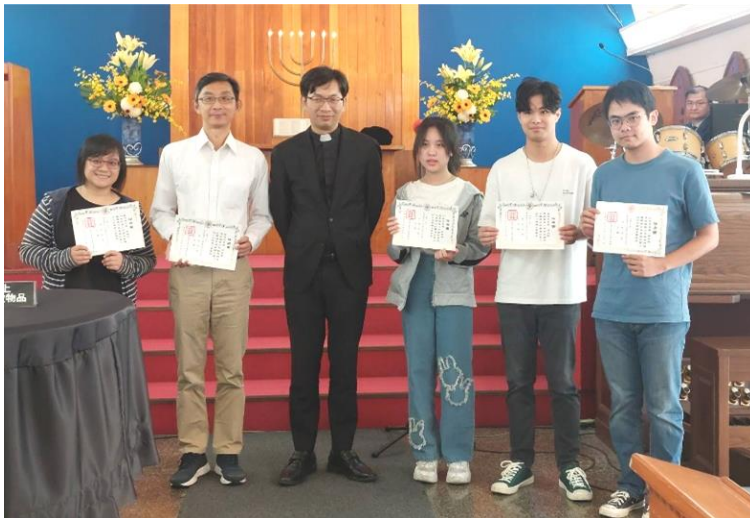
20230910 少年團契會長就任式