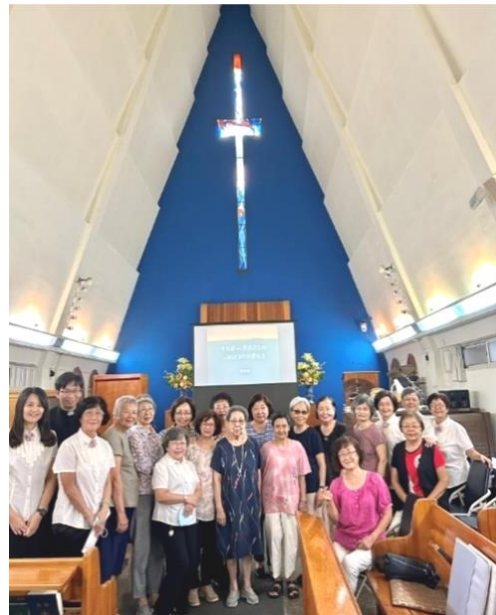
(右) 20230912 西小區聚會