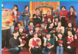
台北東門長老教會姊妹詩班