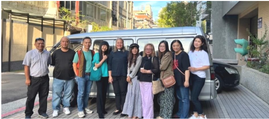
20230910 原民堂拜訪馬巴督安教會 1