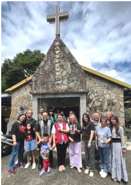
(左) 20230910 原民堂拜訪馬巴督安教會 2