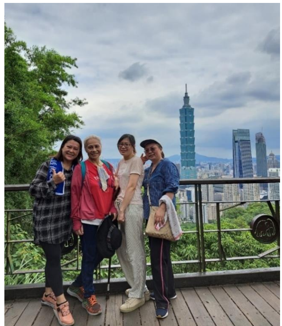
20230722 原民堂馬大與馬利亞團契- 象山健行活動