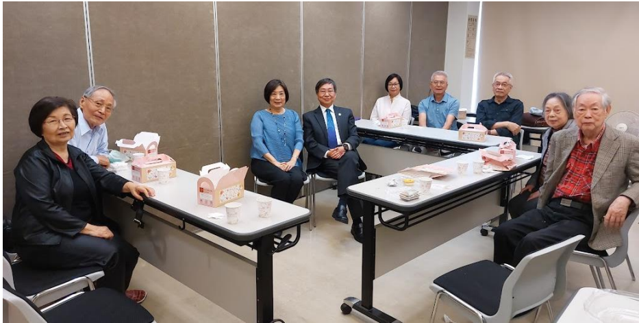
20230430 全教會小組聚會-第 6 組