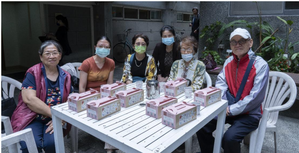
20230430 全教會小組聚會-第 8+11 組