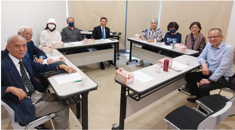
20230430 全教會小組聚會-第 5 組