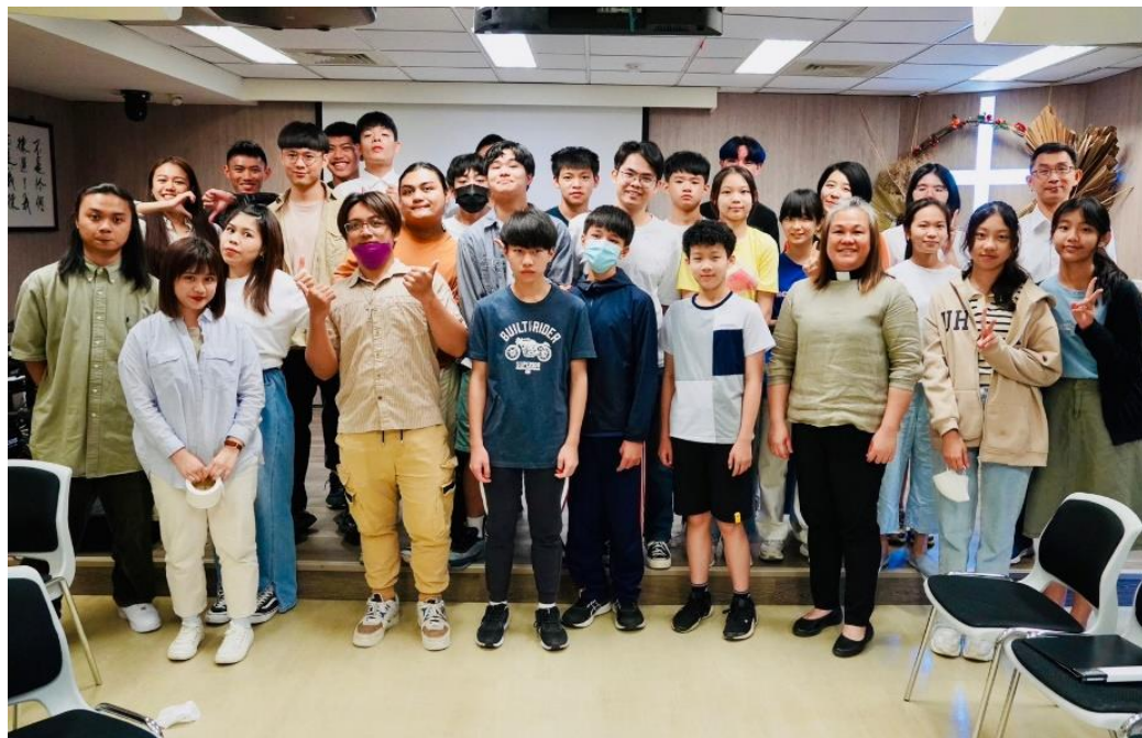
20230528-青年主日-青少年與 JS 團契