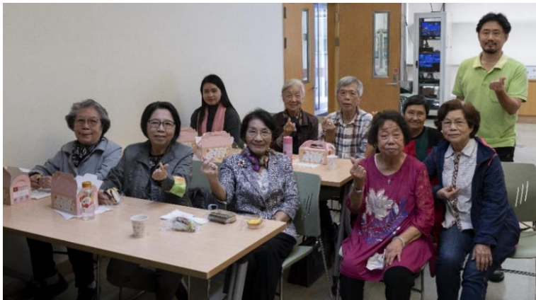
20230430 全教會小組聚會-第 7 組