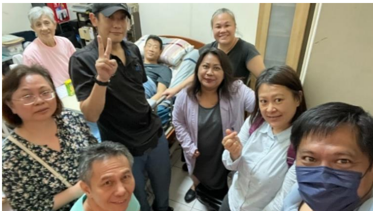
20230519 高賀子姊妹家庭禮拜