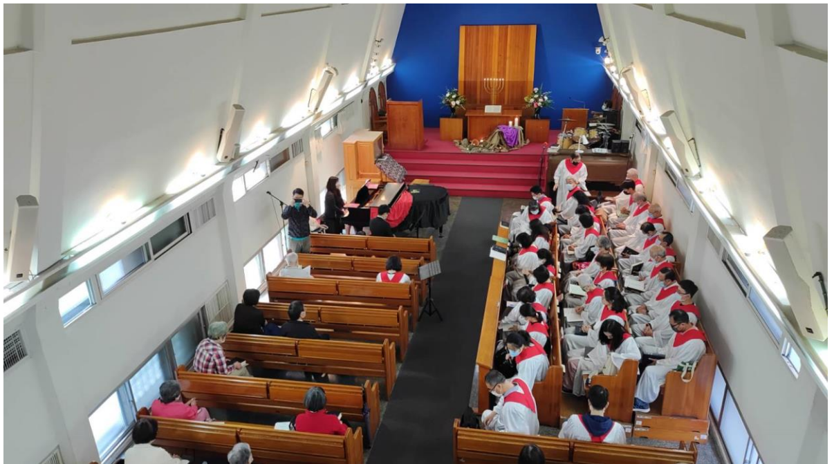
20230312 管風琴奉獻啟用禮拜