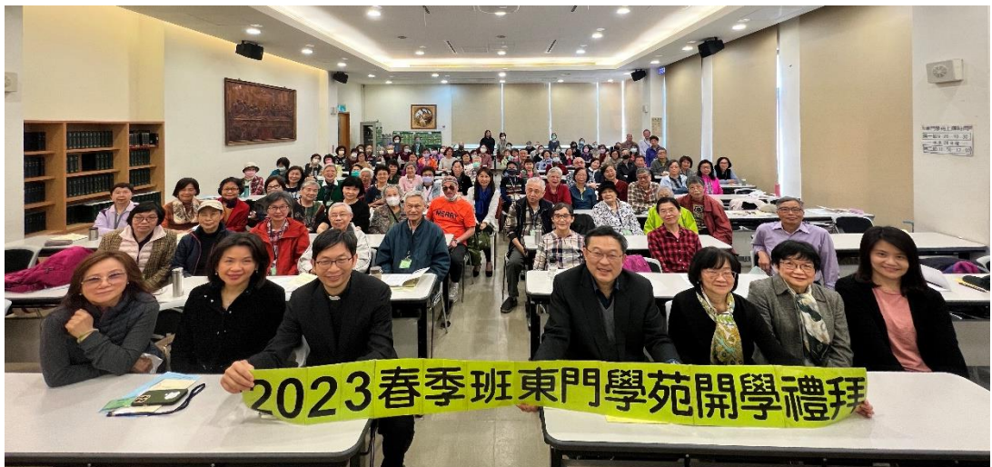
20230307 東門學苑春季班開學感恩禮拜