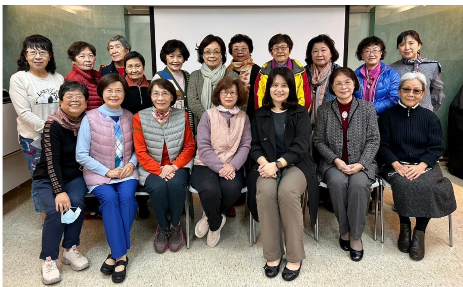
20230104 姊妹團契心靈園地聚會