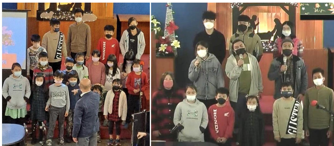
20221225 聖誕午會表演—（左）兒童主日學、（右）原民堂主日學+JS 團契