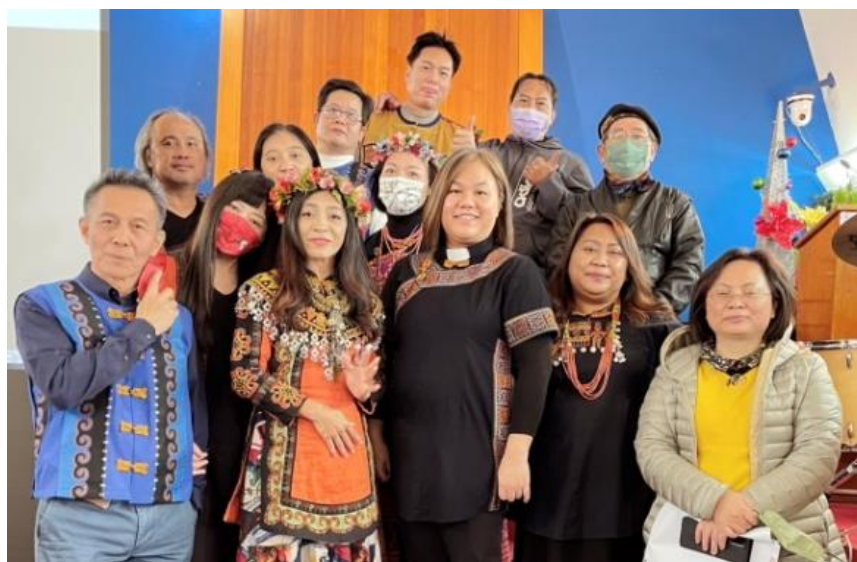
20221225 聖誕午會表演—原民堂