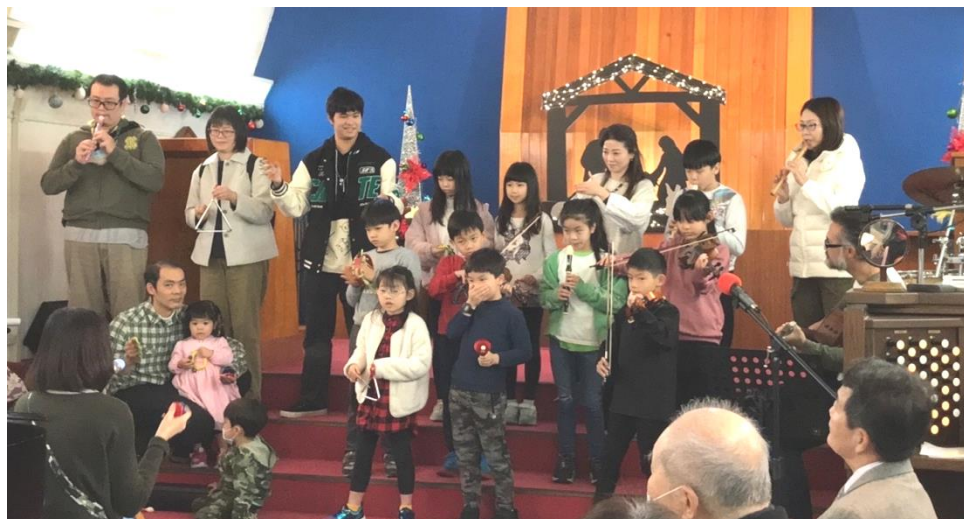
20221225 聖誕午會表演—荊棘團契