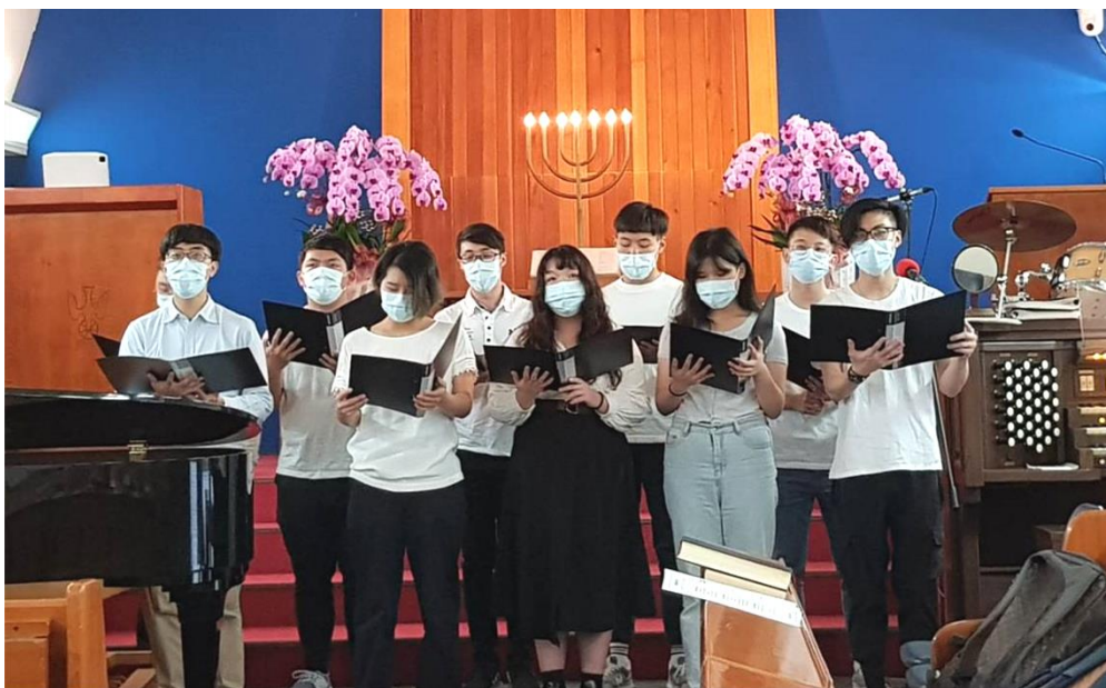
20220515 北區大專事工紀念主日，科大團契獻詩