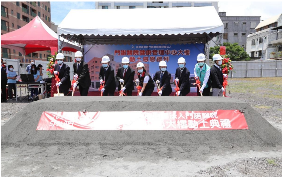
20220519 門諾醫院健康管理中心大樓動土感恩禮拜

因為祢是一 和華拉法的神， 耶和華是醫治的神， 必定會讓每一位來到健康管理中心 大樓的病患都得到身心靈疾病的醫 治。阿們！