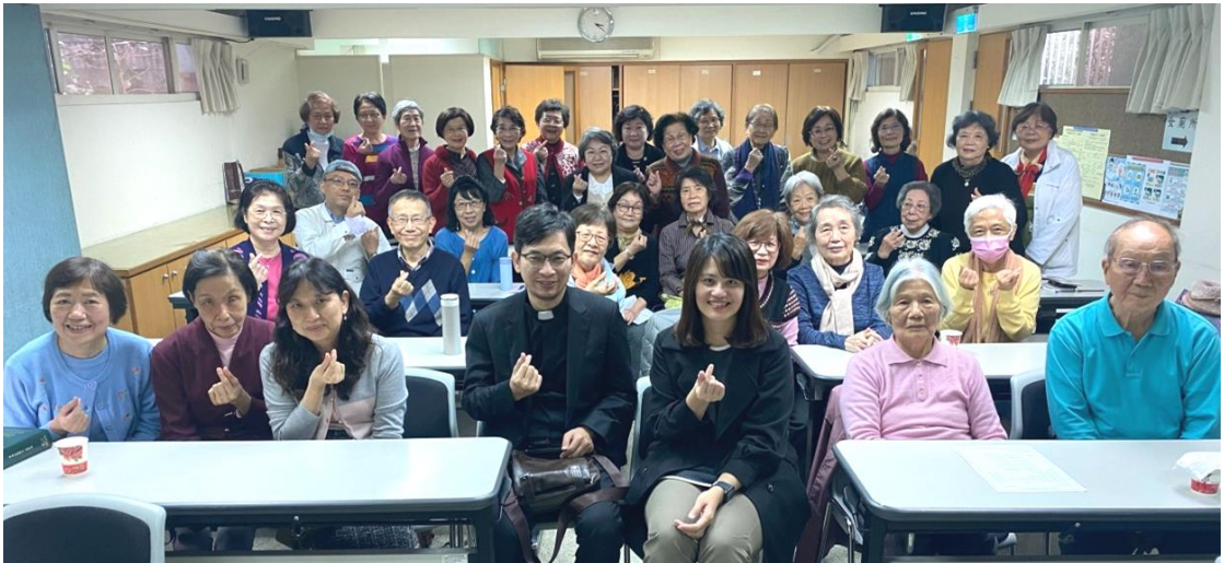
20220105 姊妹團契心靈園地聚會