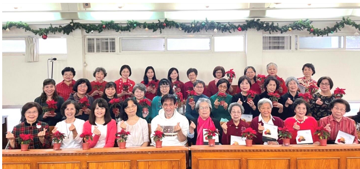
20211210 姊妹詩班聖誕歡樂慶生