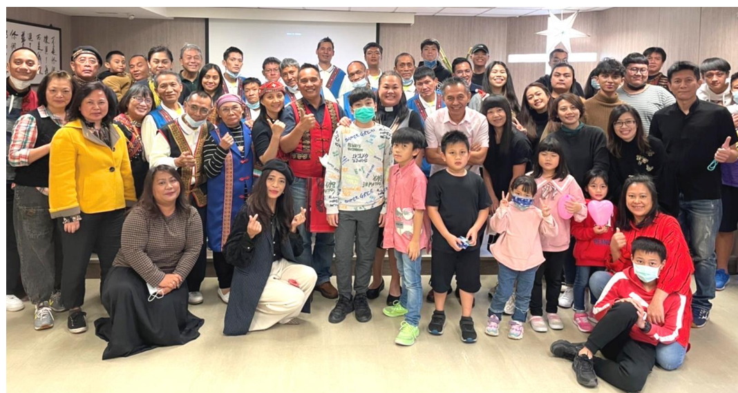
20211212 原民堂邀請台灣原住民戒酒關懷協會一起歡慶聖誕節主日