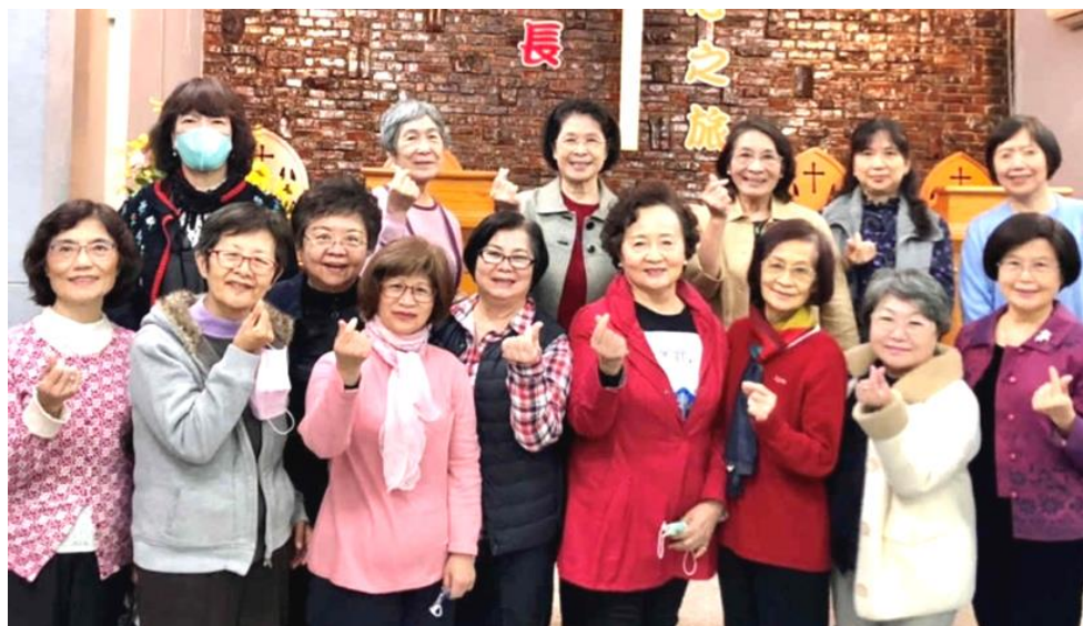
20211109 星中婦女事工部於公理堂 「台北西小區第三次聯誼聚會暨聖誕慶祝年會」