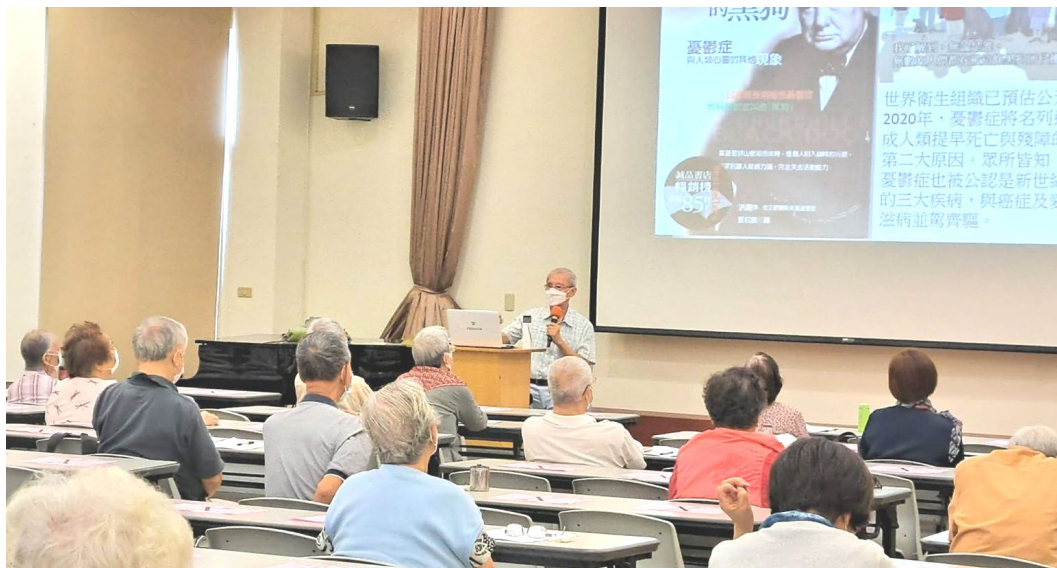
20211014 東門學苑 4B【心靈診所】