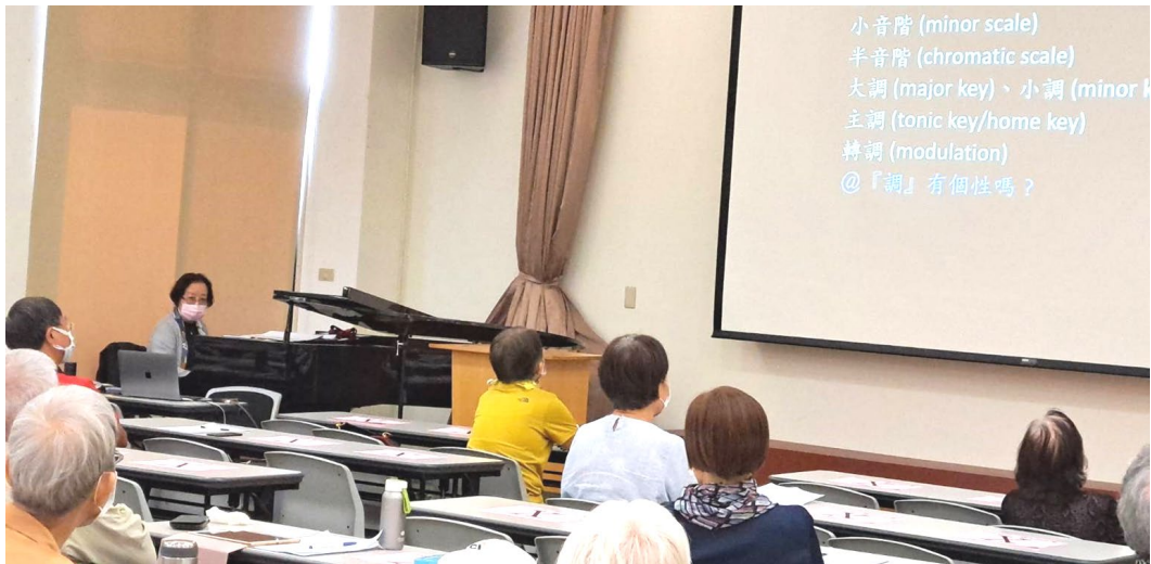
20211012 東門學苑 2B【古典音樂作品欣賞】