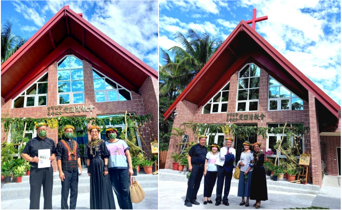
20211016 台東愛國蒲教會獻堂感恩禮拜