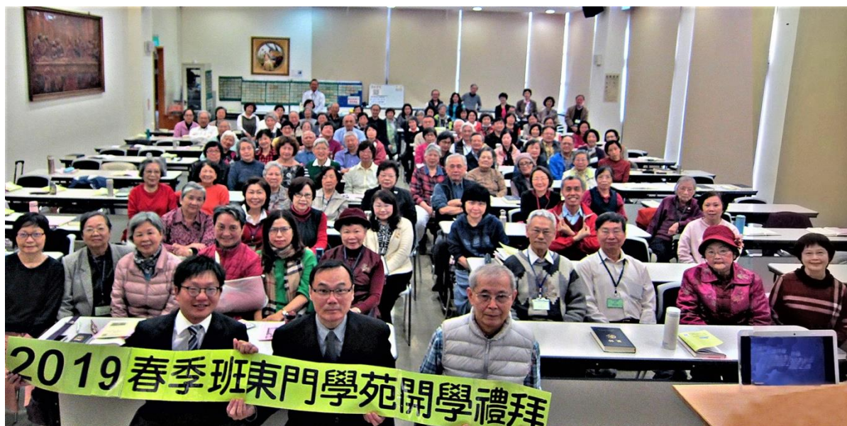
20190305 東門學苑春季班開學禮拜