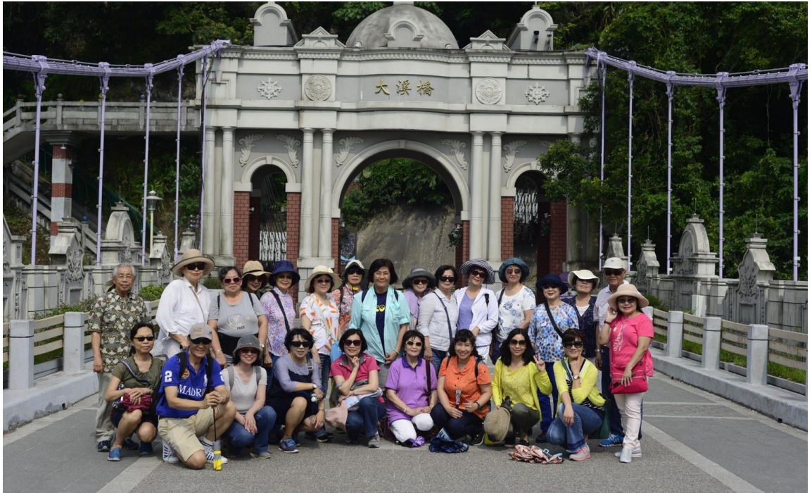
2018. 5. 25 姊妹詩班&棒鐘隊【秘境後慈湖、大溪老街】舒活一日遊