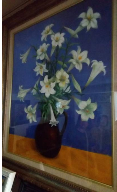
此為翁雪麗姐之作品