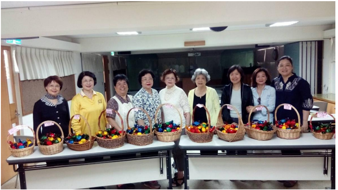
20180331 姊妹團契預備好復活節彩蛋後合影