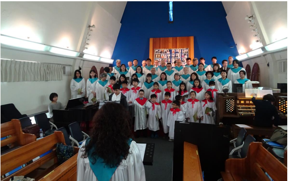
20180325 棕樹主日也是全教會追思禮拜 聖歌隊獻詩(少契與主日學數位小朋友參與)